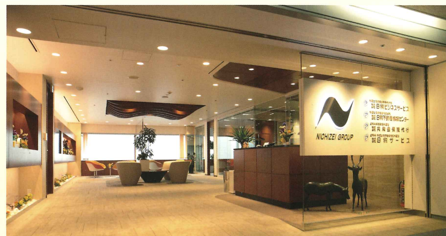
日税グループ総合受付

当社は、ご相談を頂きました保険案件に迅速に対応させていただくとともに、保険の専門家集団が高度なコンサルティング機能を提供し、関与先にご満足いただいております。